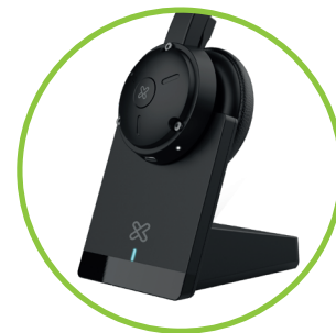
Base magnética de carga