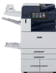
Equipo multifunción color Xerox® AltaLink® C8130/C8135/ C8145/C8155/ C8170