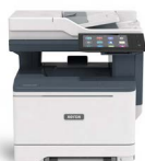
Equipo multifunción color Xerox® VersaLink® C415