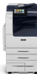
Equipo multifunción Xerox® VersaLink® B7125/B7130/B7135