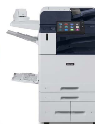
Equipo multifunción Xerox® AltaLink® B8145/B8155/B8170

*El producto no está disponible en todas las zonas geográficas, por favor consulte con su representante de ventas.