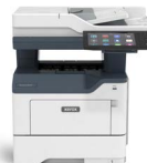
Equipo multifunción Xerox® VersaLink® B415